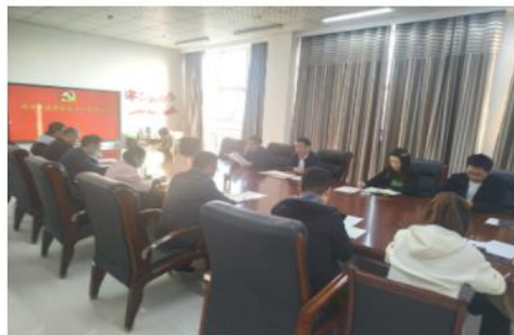
菏泽职业学院教学工作简报 (2021...) 2021-10-18